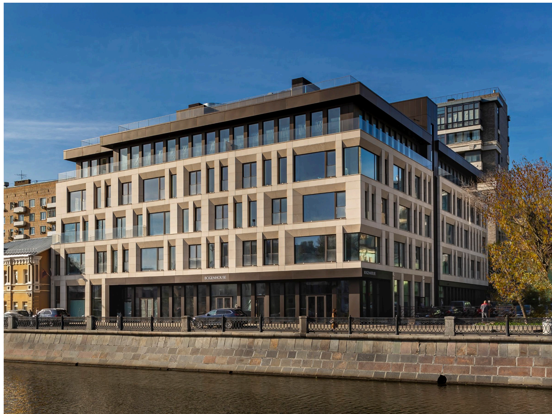
КЛУБНЫЙ ДОМ «BOGENHOUSE»